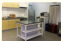
キッチンも利用できるスペース