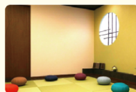
稽古などもできるスペース