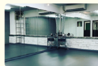
スタジオとしても利用できるスペース