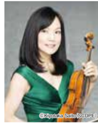
せんじゅ まりこ 千住真理子さん (バイオリニスト)