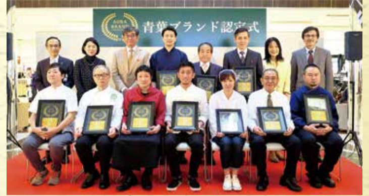
▲青葉ブランド認定式(1月27日、東急百貨店たまプラーザ店)