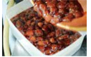
▲フレッシュ感のある、香り豊かないちごジャム

手 順: 1.イチゴを水洗いしてへたを取り、鍋の中で②をまぶす 2.1にレモン汁を加えたものをひと煮立ちさせ、そのまま一晩置く 3.実を取り出し、シロップだけを強火で煮詰める 4.シロップが煮立ってきたらよくアクを取る 少しとろみがついてきたら(沸騰してから3~5分程度)、取り出しておいたイチゴの実を戻す 5.3~5分程度アクを取りながら強火にかけ、その後中火にし、好みの硬さになったら火を止める 6.容器に移し、冷蔵庫で冷やしたらできあがり