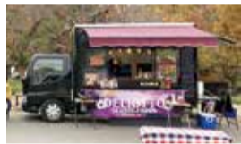
2台のキッチンカーで販売▲▼

お好みでマヨネーズをかけるともろやかさがアップします。できたてのからあげで作るのが一番おいしいですが、時間のたったからあげもしっとりさがアップしておいしいです。