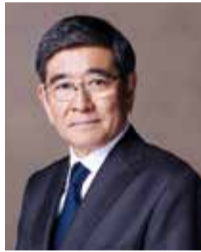
委員長 石坂浩二さん (俳優)