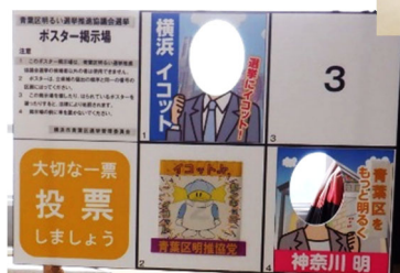
↑ポスター掲示場顔はめパネル↑