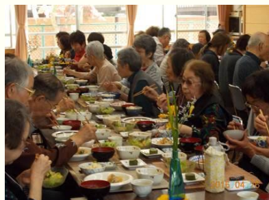
はなみずきの会 食事風景