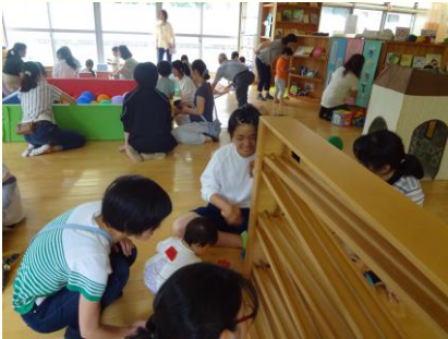
ひなたぼっこ ひろばの様子