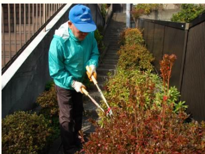
桐の会 植木の手入れ