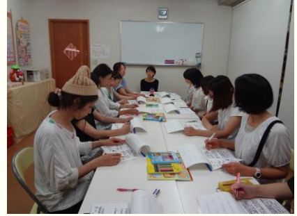
ひなたぼっこ 育児講座