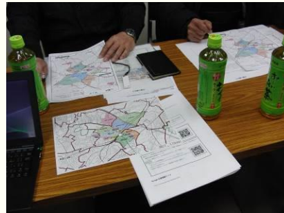
防災マップ 検討会