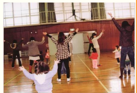
ピヨピヨクラブ 親子で体操