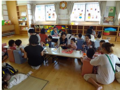
ひなたぼっこ ランチタイム