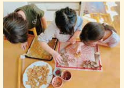
▲親子のつながりの場

申12月27日(着)(事前相談必須、下記☎へ要予約) ※申請書類は、☎または区役所2階21番窓口で配布