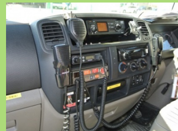
受令機、署系無線機、サイレンアンプ