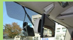
ドライブレコーダー・バックモニター