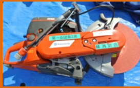
エンジンカッター