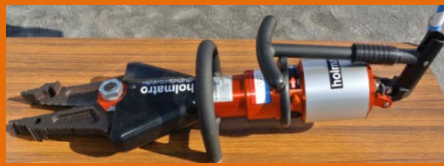
手動式油圧切断機