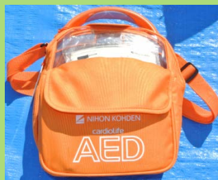
AED(自動体外式除細動器)