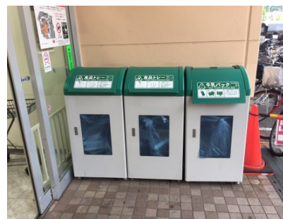
資源回収ボックス