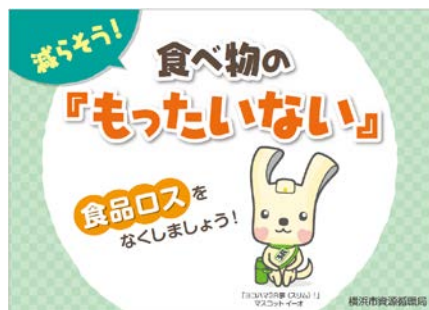
食べきりキャンペーンステッカー