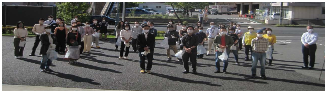
第127回 クリーン活動 (2020年9月)