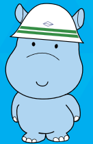
横浜市水環境キャラクター かぼのだいちゃん