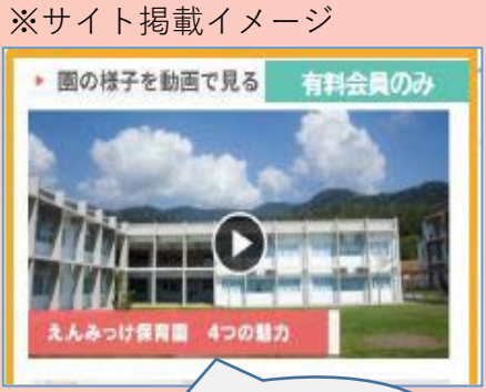
※サイト掲載イメージ