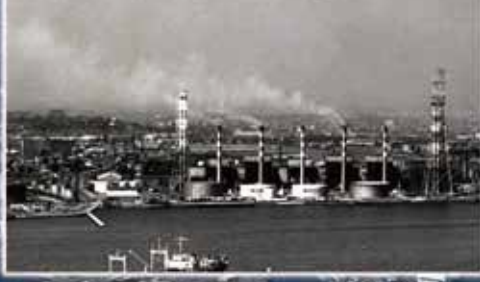
Pembangkit Tenaga Uap Yokohama (sebelum)