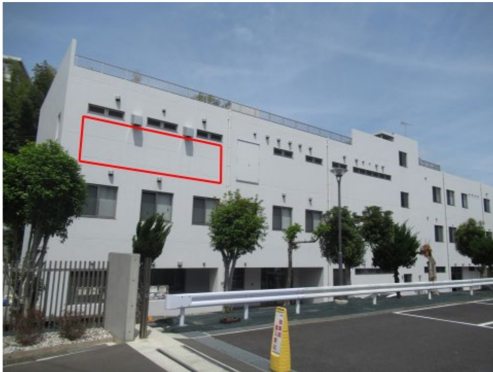
①横浜市交通局港南営業所側施設壁面