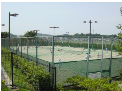
スポーツ施設区:庭球場