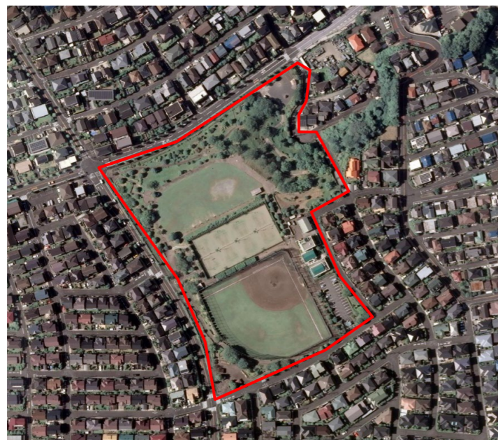
横浜市環境創造局第11次緑地環境診断調査(令和元年度) 航空写真データ