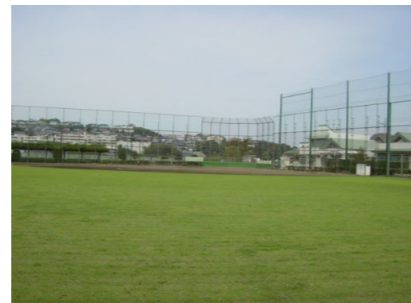
スポーツ施設区:野球場