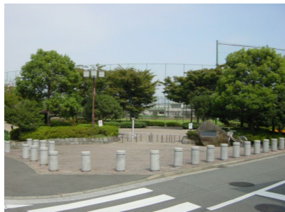
エントランス区:南入口広場