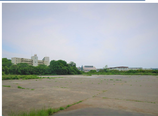
〈航空写真および東側前面道路からの写真〉