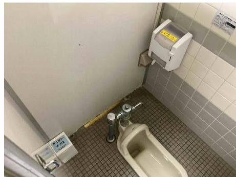
1階女子トイレ（和式）