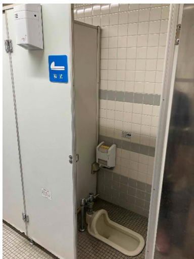
1階男子トイレ（和式）