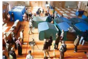
▲スペースの区割り訓練