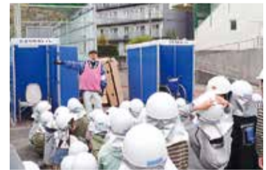
▲仮設トイレ設置訓練

問合せ 総務局地域防災課 ☎045-671-2011 ☎045-641-1677