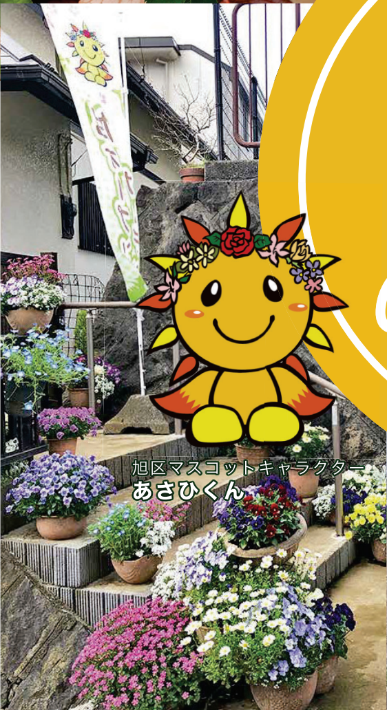
旭区マスコットキャラクター あさひくん