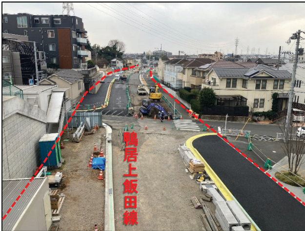
駅前からさちが丘方向を望む (令和5年2月撮影)