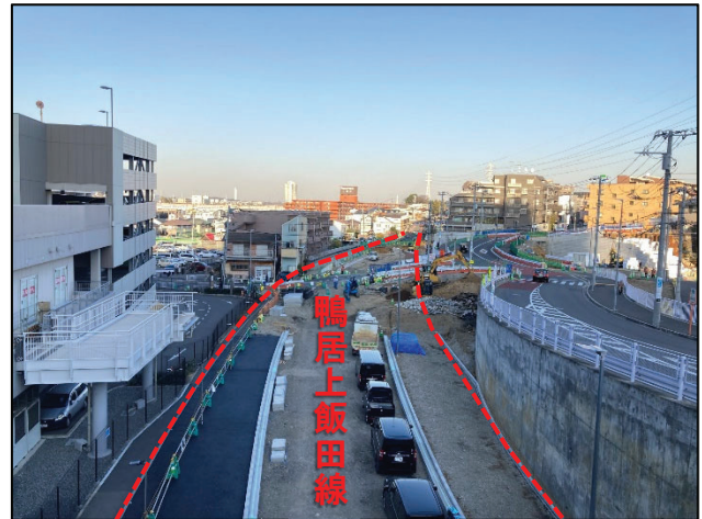
駅前から本宿町方向を望む (令和5年2月撮影)