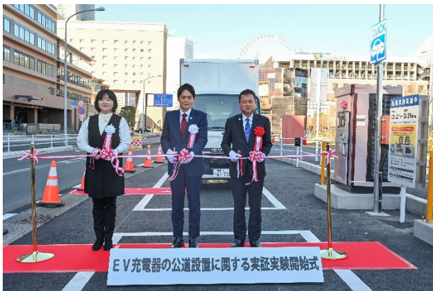
左から株式会社 e-Mobility Power 四ツ柳社長、 山中市長、瀬之間議長