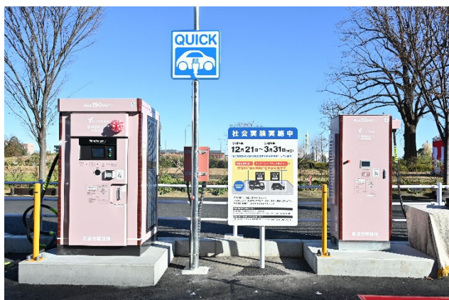
左：超急速充電器 150kW、右：急速充電器 50kW