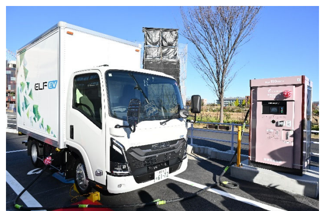
EVトラックへの充電の様子