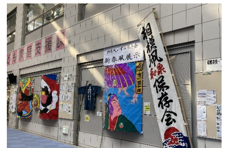
《過去の風展示の様子》