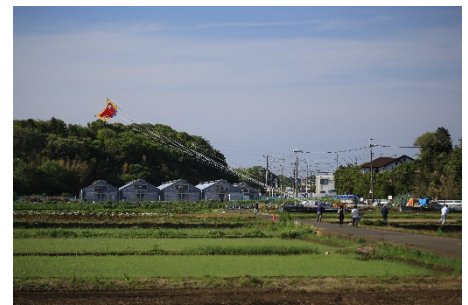
《過去の風揚げ会の様子》