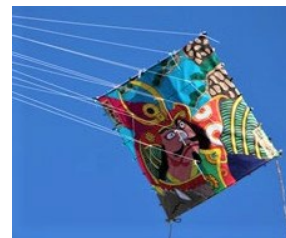
【昨年度開催の様子】