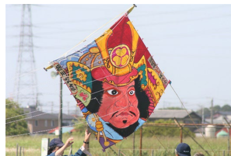
《令和5年度の凧揚げ会の様子》