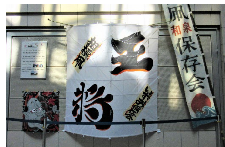
《令和5年度区民ホール展示の様子》