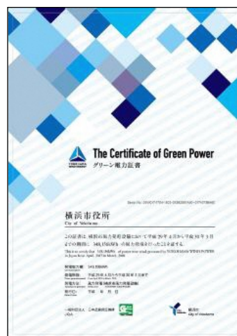
ハマウイング外観とグリーン電力証書