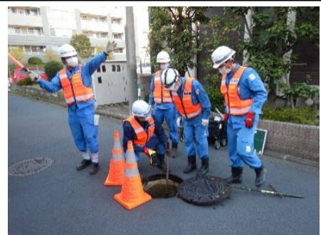
写真：実地調査訓練の様子