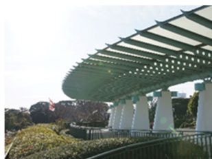
港の見える丘公園