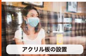
アクリル板の設置