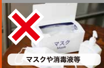
マスクや消毒液等