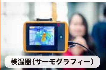
検温器(サーモグラフィー)