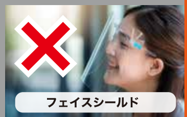
フェイスシールド