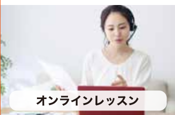
オンラインレッスン