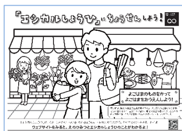
◀エシカル消費啓発ぬりえ(線画)