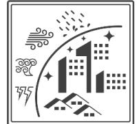
よこはま防災力向上マンション

このたび申請があった 既存マンション4件を『本認定』 、 新築マンション2件を『計画認定』 しました。