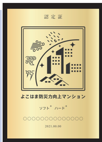
認定証のイメージ

ハード+（プラス）認定を取得するマンションのうち、地域の防災力向上に資する施設等を設けた場合、市街地環境設計制度等を活用して、容積率の緩和を行います。