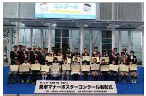
令和5年度 表彰式写真