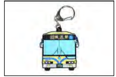
市営バスラバーキーホルダー