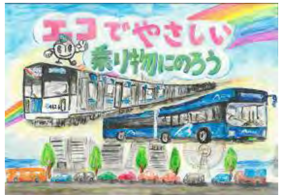
令和5年度 横浜市長賞 受賞作品