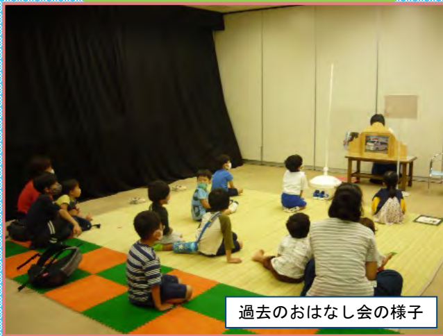
過去のおはなし会の様子