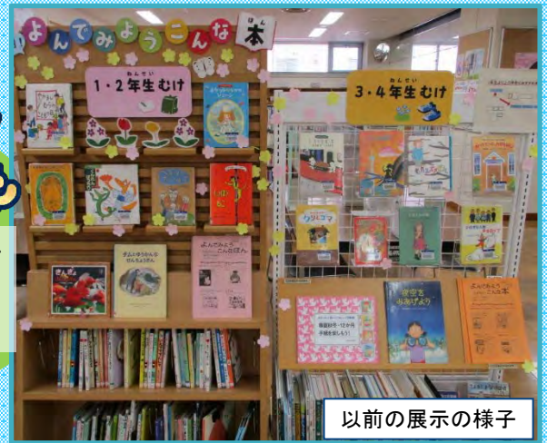
以前の展示の様子