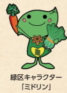
緑区キャラクター 「みどり」