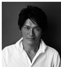
高橋 克典 氏

横浜市出身。TBS「サラリーマン金太郎」やテレビ朝日「特命係長 只野仁」などの主演ドラマがヒット、俳優として数多くの映画やテレビドラマで活躍。現在は、BS テレビ東京「ワタシが日本に住む理由」、NHK Eテレ「ららら♪クラシック」などにMCとして出演中。