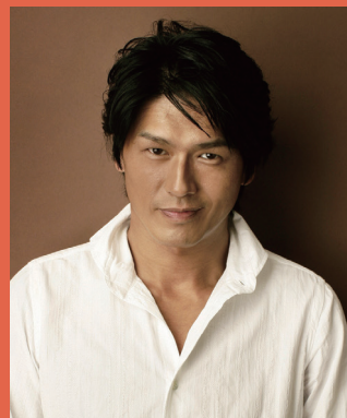
ゲスト出演者 高橋 克典 氏