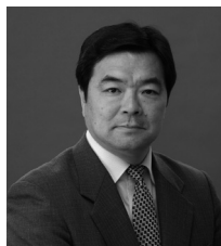
高橋 進 氏

横浜市出身。TBS「サラリーマン金太郎」やテレビ朝日「特命係長 只野仁」などの主演ドラマがヒット、俳優として数多くの映画やテレビドラマで活躍。現在は、BS テレビ東京「ワタシが日本に住む理由」、NHK Eテレ「ららら♪クラシック」などにMCとして出演中。