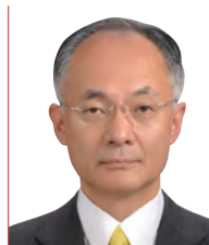
辻 琢也 氏 一橋大学大学院法学研究科教授

同志社大学文学部卒業後、CBCテレビにアナウンサーとして入社。バラエティ番組から報道番組まで幅広く担当する。「ゴソマ〜GOGO!Smile!〜」(CBCテレビ制作、月〜金13:55〜)の番組開始時からMCを務める。2020年3月にCBCを退社しフリーアナウンサーへ転身。2019年の週刊文春の好きなアナウンサーランキングでは、在京キー局の有名アナに混じって異例の5位、2021年のJ-CASTニュースの好きなワイドショーのMCでは1位を獲得。著書「ゴソマ石井のなぜか得する話し方」(ダイヤモンド社)などがある。