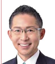
中川 貴元 氏 総務大臣政務官

早稲田大学商学部卒業、名古屋市議員(平成7年4月当選後、7期連続当選)、名古屋市議員、指定都市議会議長会会長、衆議院議員初当選(第49回総選挙)、自由民主党法務・自治関係団体委員会副委員長、自由民主党財政・金融・証券関係団体委員会副委員長、自由民主党地方組織・議員総局次長を経て、令和4年8月総務大臣政務官(第2次岸田改造内閣)