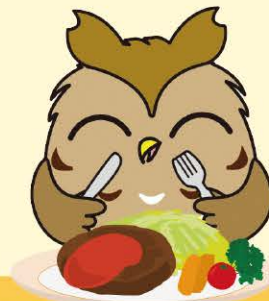
瀬谷区 マスコットキャラクター せやまる