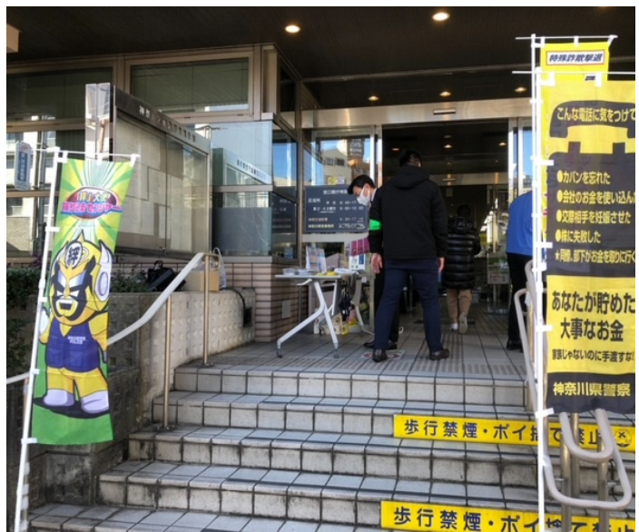
▲区役所での啓発キャンペーンの様子 (令和4年1月実施)