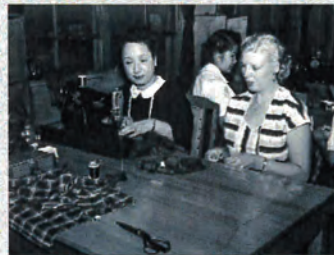
孤児のために洋服を作る内山県知事夫人たち