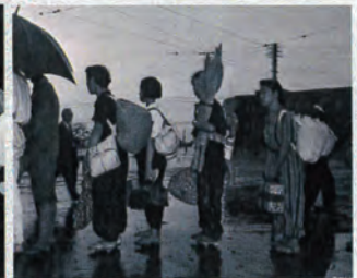
市電を待つ買い出しの列