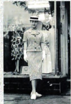
ボンクー洋装店の前で (横浜市史資料室所蔵 ボンクー洋装店資料)