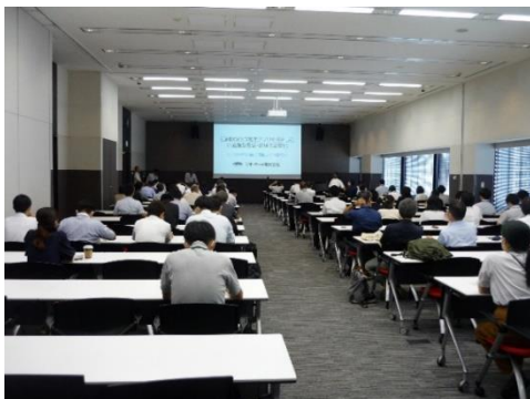
プレゼンテーション会場

【参加者数】 1,586名（〔内訳〕会場参加321名、オンライン参加延べ1,265名）