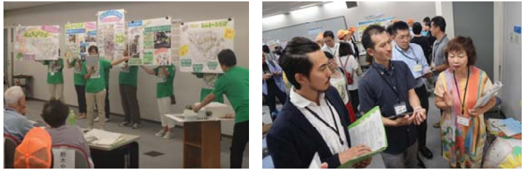
【昨年度の一次コンテストの様子】