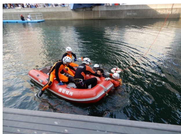
ゴムボートによる溺水者救助訓練