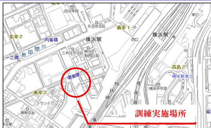
図1 訓練実施位置図