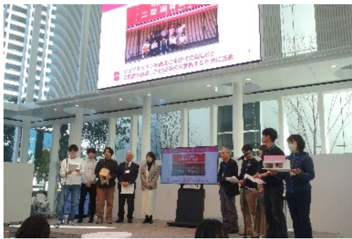
▲まち普請コンテスト発表の様子