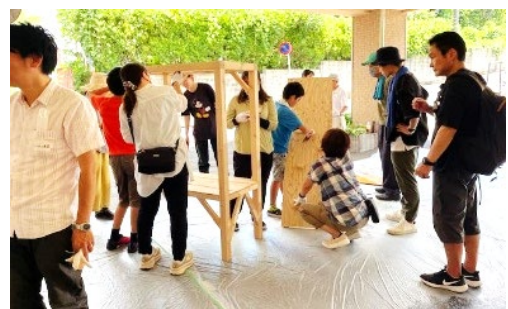
▲まちの中にとどまる場所を作ることをテーマに椅子づくりワークショップを開催