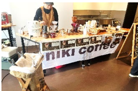
▲フェスの様子。コーヒー店を営む地元企業が出展

常盤台地域ケアプラザ、横浜国立大学、地元企業と地域住民が連携し、ワークショップやフェスを開催しました。地域に住む多世代が訪れ、昔遊びやまち歩きなどを通じて地域の交流が生まれました。