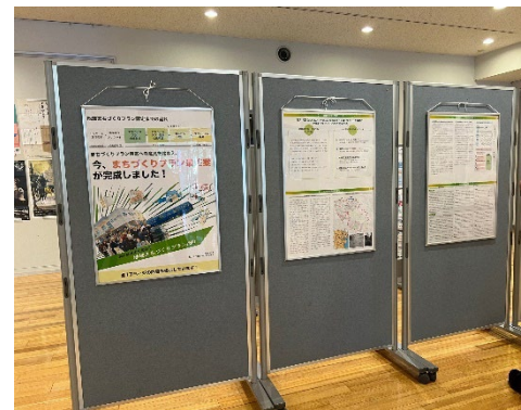
▲横浜国立大学中央図書館にプランを掲示