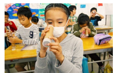
■ マイクロプラスチックで万華鏡作り