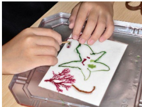
■海藻おしばづくりの様子

海藻から地球環境を考え、色鮮やかな海藻を使ったおしばづくりで創造力を楽しむ二本立てプログラムです。