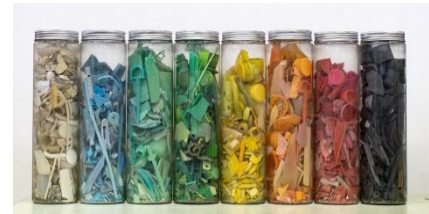
■海岸ごみを色別に詰めたカラーボトル

海岸に落ちているプラスチック片を色別に詰めたカラーボトルや海岸美化啓発パネルなどを展示します。