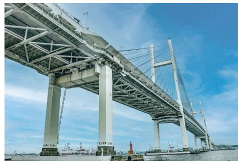
■横浜ベイブリッジスカイウォーク