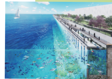
多様な生物の生息に配慮した「生物共生型護岸」