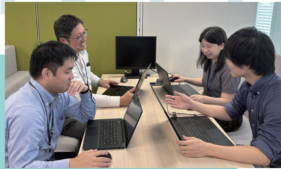
「パマトコ」の機能拡充に関する打合せ