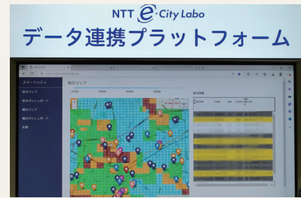
派遣先:東日本電信電話株式会社での業務

現在はデジタルの力を活用した区役所のサービス向上や業務の効率化などを担当しています。デジタル技術は日進月歩で、次々と新しいサービスが出てきています。技術もニーズも多様化し変化しているなか、トレンドに追いつきながら、速く小さく実行し、次に繋げていくことの大切さを学びました。横浜市のイノベーションやデジタル分野においても、社会のニーズやトレンドに追いつくスピード感が求められていると思います。まだアナログな部分が残っている行政と、最先端のICT企業の両方の働き方を経験できたからこそ、それぞれの長所と短所を自分の目で見ることができました。これからの行政サービスのあり方や自分たちの働き方にも、ベストミックスの形で組み合わせて、進化させていきたいと思っています。