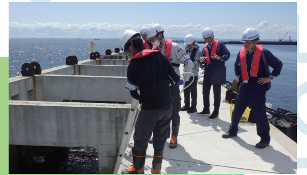
整備後の生物共生型護岸での現地調査