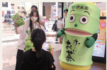
派遣先:株式会社伊藤園での業務

現在はモビリティ関係のスタートアップ支援を行っています。担当しているスタートアップや企業向けの広報では、溢れ返るセミナーの中から興味を持ってもらう必要がある、人事交流での販売促進の経験で身につけた「選んでもらうキッカケ」になる情報発信のスキルを、今の業務に取り入れています。また、派遣先ではグローバルな視点を共有したり、市場調査や業界研究などから、お客様のニーズやインサイトを汲み取ることを大事にしています。横浜市でも、他都市はもちろん、海外都市の情報など幅広い視野で情報をキャッチする必要があります。いつの時代も魅力的な横浜市であり続けるために、アンテナを張って業務に取り組んでいます。