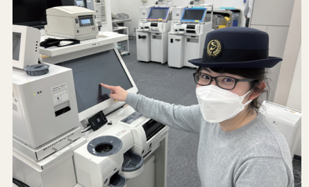
派遣先:相模鉄道株式会社での業務

現在は横浜市への居住促進プロモーションを担当しています。派遣先の相模鉄道では、相鉄グループの事業会社という強みを活かして、ホテル、流通や不動産などの多種多様なグループ会社と連携して業務が行われていました。私自身も流通部門の担当者で連携することで、お客様の満足度も向上できる「win-win」で規模の大きいキャンペーンを実現できました。横浜市でも、様々な区局があり、それぞれ強みを持っているので、活用しない手はないと思い、各区局と連携を強化して業務を進めることを心がけています。例えば、居住促進に関係する区局を一堂に集めた「居住促進プロモーション検討会」を運営し、教育、子ども、都市整備、建築などの専門部署のメンバーとの議論や意見交換を通じて、取組のアイデアを膨らませています。