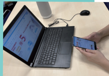
「パマトコ」の動作確認作業