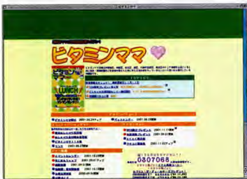
ビタミンママホームページ ( http://www.vitamin.mama.com )

田園都市沿線は、もともとキャリアを持った専業主婦が存在する場所である。彼女達の能力を再び社会へと解き放つのは、家に居ながらにしてネットワークを張り巡らせることのできるITの能力(ちから)である。