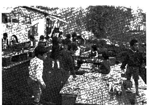
写真一 3 お店屋ごっこ(すぎの子会)

長をかげから助けしてくれる良いリーダー、何人かの仲間、遊ぶための広い場所、豊かな自然であると考えます。」