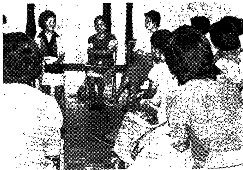
写真一 母親たちの話し合い(すみれ会)

母親の学習グループである。母親がよい家庭教育を行うための活動で、話し合いの他、講師を呼んで勉強会もやる。したがって〇歳から二歳児をもつ母親の集まりも月二回開かれている。三歳児は一番多く、二十二名の二クラスが週一回づつ、四、五歳児は週五日制、お弁当持参、十二時三十分までである。団地の中の保母や教職の資格者が保育にあたりているが、木曜日は、保母は休みで母親が交代で保育する。