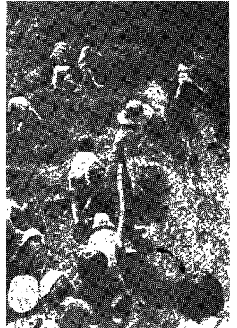
写真一 2 “さばく”で山登り(すぎの子会)

る疑問がでてきた。第一には、入園料保育料が家計を圧迫するほど高いこと、第二には、私立であるがゆえに経営本位にならないかということ、第三には、クラス的人数が多すぎて、保育内容が画一化するのではないか、第四に、入園のためには二日前から徹夜の行列をしなければならぬことである。結局、この増設運動の中心メンバーの中で「はたして幼稚園に入れることが必要かどうか」という問いにつきあつた人たちが、自分たちの手で望ましい保育の場をつくらうということになった。