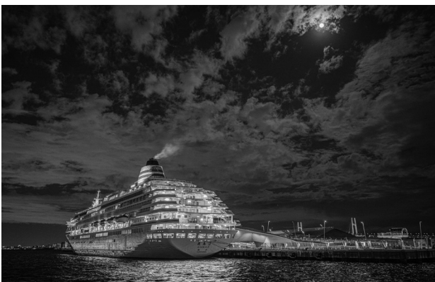
「月光」 (横浜港客船フォトコンテスト2021 特選作品より)

より多くの人に客船やみなとに興味をもつていただくため、平成16年から他団体と共催で、「横浜港客船フォトコンテスト」を実施し、入賞作品を大さん橋国際客船ターミナルなどで展示しています。