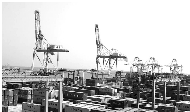
国内最大級の本牧ふ頭BCコンテナターミナル

BCターミナルは、令和4年7月に、水深16m岸壁の延長を390mから470mに延伸し、更なる機能強化を図りました。また、D突堤では、D4・D5ターミナルの一体的な運用と超大型コンテナ船の受入れに向けて、D5ターミナルの荷役方式を生産性の高いタイヤ式門型クレーン方式へ転換するとともに、ヤードの拡張等の再整備を進めています。A突堤では、コンテナ貨物取扱量の拡大と定着に向けて、ロジスティクス拠点の整備を進めています。