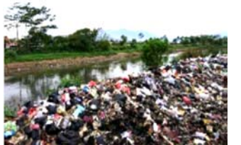
▲海外のプラスチックごみの状況（環境省）