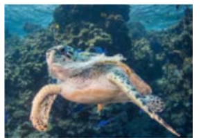
▲海洋生物への影響（環境省）