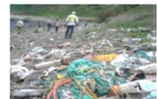
▲海岸での漂着ごみ（環境省）