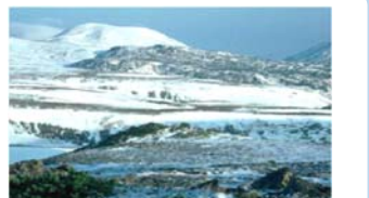
▲地球温暖化の状況（環境省）