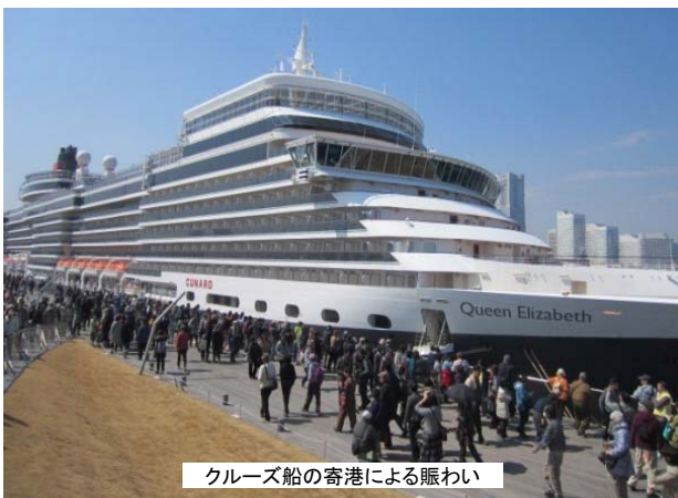
クルーズ船の寄港による賑わい