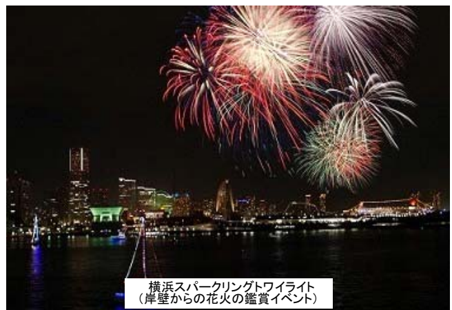
横浜スパークリングトワイライト (岸壁からの花火の鑑賞イベント)