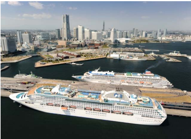
大さん橋国際客船ターミナル

今後もみなとオアシスとしての登録を契機として、関係者一丸となって、岸壁を含む大さん橋ふ頭全体における各種イベントや、継続的な地域振興の取り組みに対する活動支援など、安全性を第一に、公益性を確保しつつ、取組を進めて参ります。