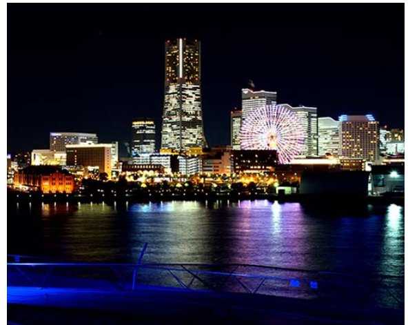
大さん橋国際客船ターミナルから眺める夜景