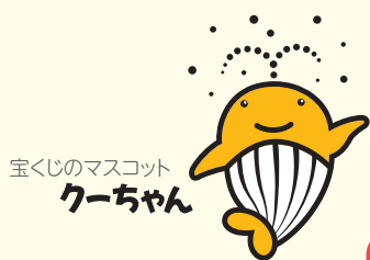
宝くじのマスコット クーちゃん