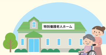
特別養護老人ホームの開設