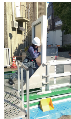
水災害体験装置 (左)流水歩行体験 (右)ドアへの水圧体験