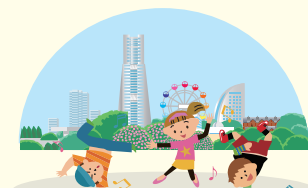
文化芸術活動の支援

市内の売り場、または宝くじ公式サイトでお買い求めください! スマートフォンの方はアプリをダウンロード!