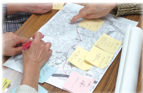
まち歩きのコースを地図で確認

会場を1カ所に固定してしまうと、参加しやすい人に偏りが出てしまうので、地区内の自治会館を順番に会場にすることで、 地区全体の住民が参加しやすいように工夫 しています。それぞれの自治会の協力も得ながら、各回の担当者が中心となって企画・運営を行っています。