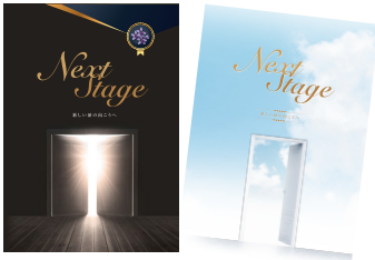
「Next Stage」 平成28年度作成版(左) 平成29年度作成概要版(右)