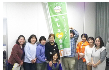
「みんなの食堂」では、 お揃いののぼり旗を 掲げて皆さんの お越しをお待ち しています。