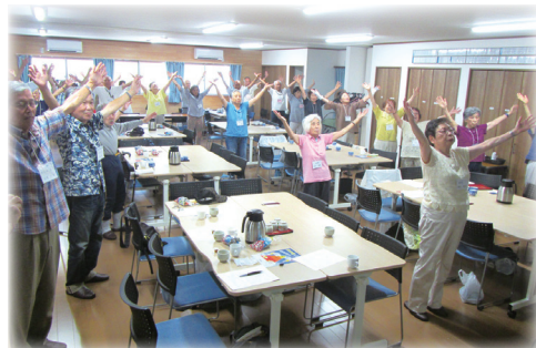
コーヒープレイク、カラオケ、毎回最後にはみんなで体操！

このサロンには、「誰でも参加できる会に」「続けながら検討し、どんな形にでもなっていけるように」「参加者が自主的に関われる内容に」という思いがあります。手伝いたいという方も現れ、担い手づくりにもつながっています。毎回終了後には、課題や内容を検討。どんな風にしたら担い手も参加者も楽しめるか、回を重ねるごとに新しい工夫やアイデアが活かされています。