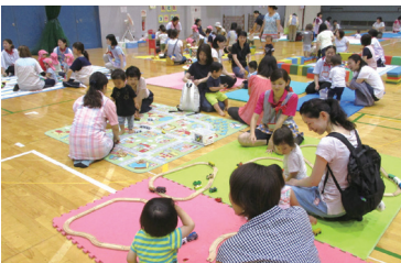
平成29年6月 保土ヶ谷スポーツセンター 「にこやかほがらか 親子の広場」 202組421人の親子に ご参加いただきました。