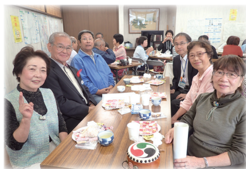
お茶を飲みながらの歓談 (ティーサロン)を楽しむ様子