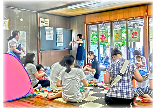
みんなで手遊び歌をしたり、子どもたちとママたちの交流の場となっています！

立ち上げ準備期には、数か所の子育てサロンの見学に行きました。エリア別子育て支援連絡会で、保育士にお勧めの遊びを聞いたり、子育て支援拠点こっころで道具を借りられることがわかりました。毎月のテーマや内容には悩むこともありますが、日頃の活動や会議等でもアンテナを高くして、様々な情報を得て、参加者に楽しく、継続的に来てもらえるような工夫をしています。また、区全体の主任児童委員定例会にて、他地区のサロンがどのようなことをしているのか知りたいと提案したことで、毎月、各地区のサロン紹介をすることになり、区全体でも情報交換ができるようになりました。