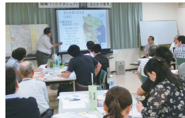
平成29年度実施 まちの成り立ちに ついでに講義風景