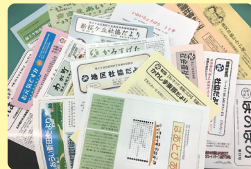
地区ごとのセンスが光る広報紙の数々

区内の地区社会福祉協議会では、ほぼ全地区で定期的に広報紙を発行しています。 こんなに広報紙があるのは市内でも珍しいことです。