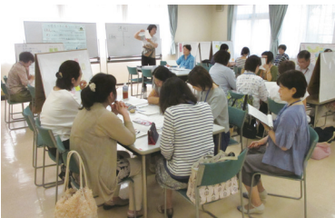
講座を組み立てる ポイントを学ぶ 受講者の皆さん。 仲間と学びあうって 楽しい!