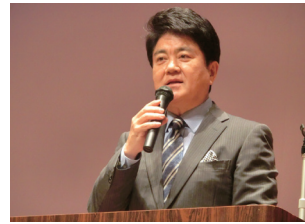
平成30年3月 ほっとなまちづくり講演会 講師:堀尾正明氏 (フリーアナウンサー)