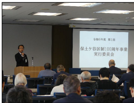
← 第1回委員会の様子