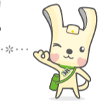
スリムヨコハマ3R夢! マスコット イーオ