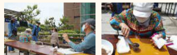
5月に区役所で開催した花の育て方講座の様子

また、4年3月31日(木)まで花の種を 無料で配布しています。※なくなり次第終了 詳しくは、ホームページをご覧ください。