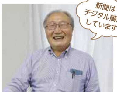
屏風ヶ浦地区連合町内会会長